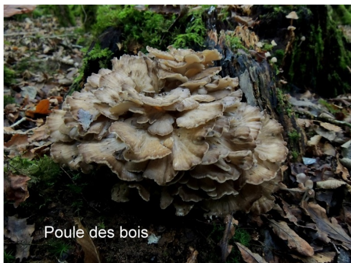
Poule des bois

Les rencontres de cèpes et de trompettes des morts n'ont pas fait