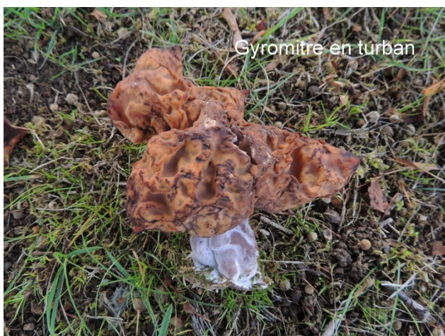
Gyromitre en turban

dont ce Gyromitre en turban que personne n'avait jamais vu, tant il est rare chez nous en plaine. Nous ne pouvons pas non plus rater la « poule des bois » qui, d'après la presse locale,