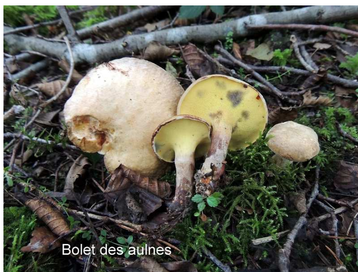
Bolet des aulnes

fait son apparition en forêt de Rougeau (signe du réchauffement climatique).