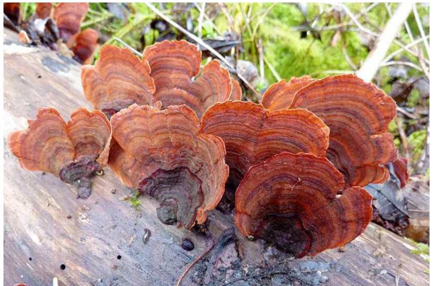
Stérée très mince , Stereum insignitum